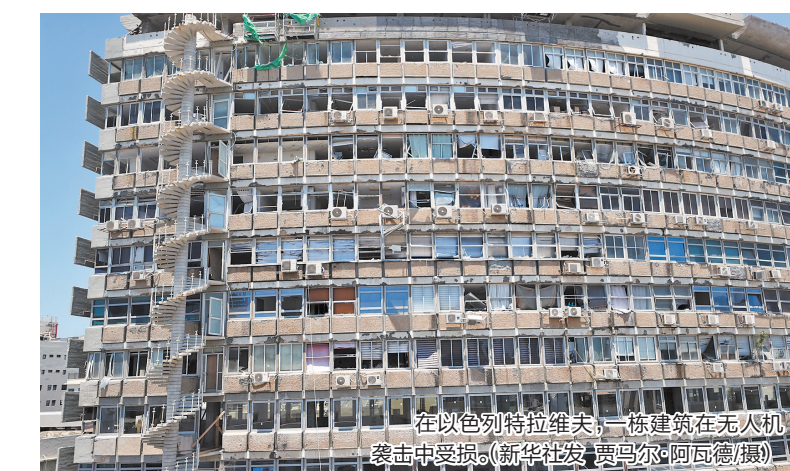
在以色列特拉维夫,一栋建筑在无人机袭击中受损。

以色列军方随后发表声明确认,袭击特拉维夫的无人机来自也门胡塞武装。声明称,胡塞武装使