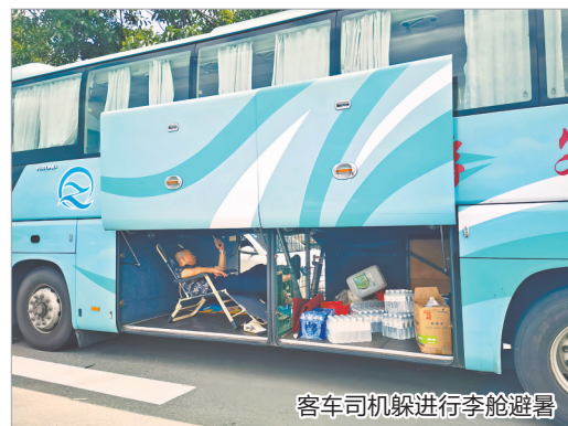
客车司机躲行李舱避暑