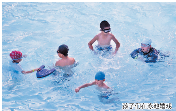
孩子们在泳池嬉戏