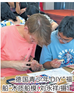
德国青少年DIY“福船” 木质船模(刘永祥/摄)