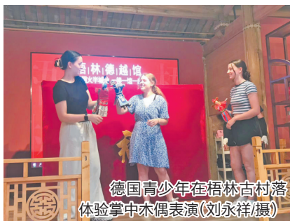
德国青少年在梧林古村落 体验掌中木偶表演