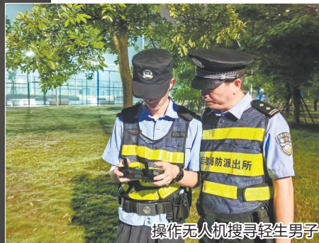
操作无人机搜寻轻生男子