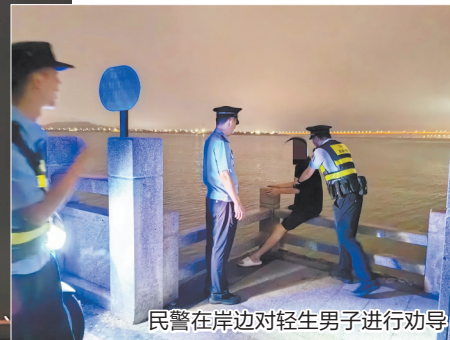
民警在岸边对轻生男子进行劝导