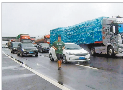
周某在高速路车道上奔跑

本报讯(融媒体记者林志安 通讯员陈旖旎 文/图)什么情况?一名穿着拖鞋的男子竟在高速路车道上奔跑!