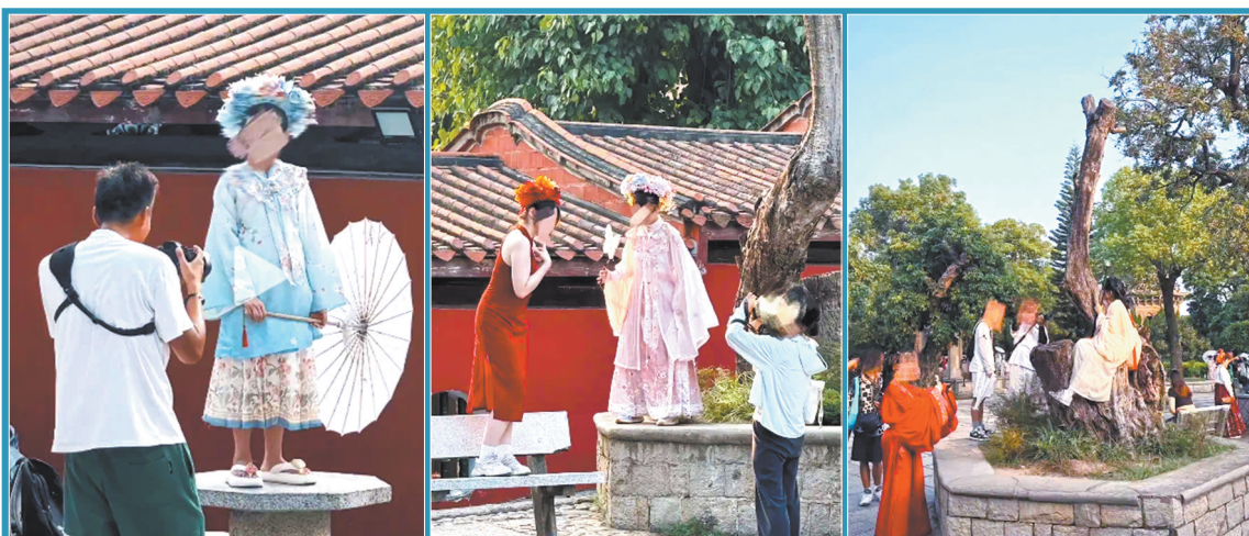
开元寺旅拍乱象(视频截图)