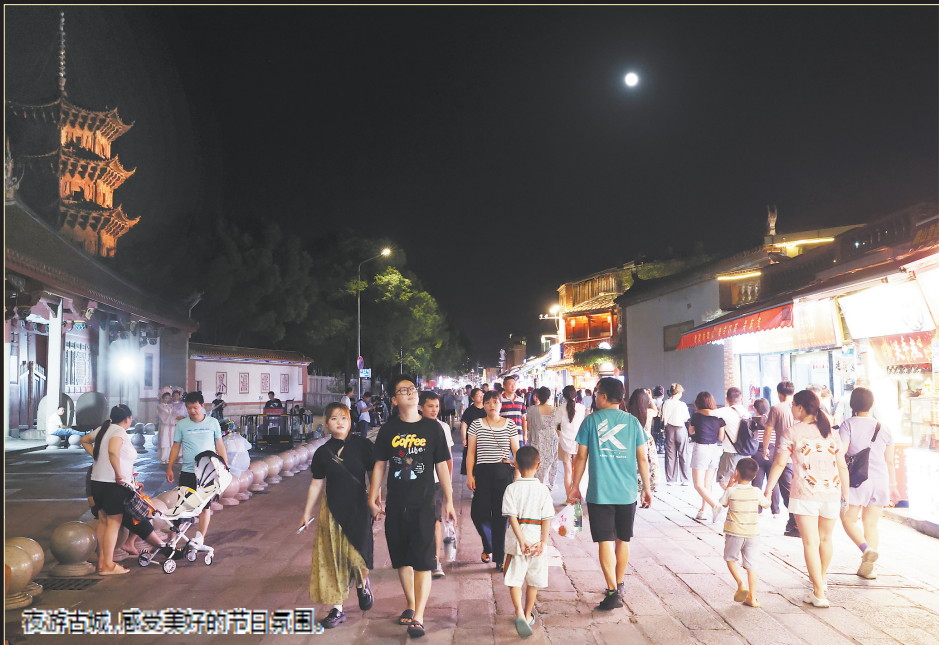
夜游古城,感受美好的节日氛围。