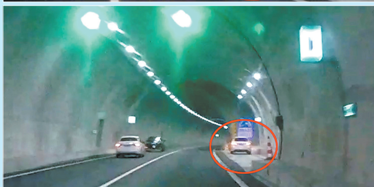
两辆小车停在同一个应急车道上,两名睡觉的司机均受查处。