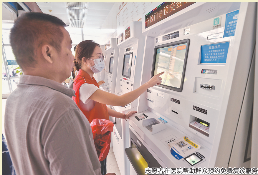
志愿者在医院帮助群众预约免费复诊服务