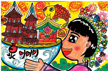
《宋元中国·海丝泉州》

红砖厝,刺桐树,琉璃瓦。古厝周边使用清新的黄绿色调表现出城市的生机盎然,整个画面色彩明亮、充满活力,呈现了泉州城的自然美和历史底蕴。