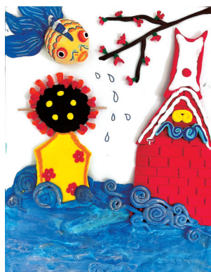
《山海真情,有“福”泉来》

小朋友巧妙地选择了滴水兽、刺桐花、古厝、簪花女、海浪等代表性元素,滴水兽体现了古建筑的精巧细节,刺桐花展现出城市的特色风貌,古厝则是泉州传统建筑文化的承载,簪花女彰显了当地民俗风情,海浪则凸显了泉州作为沿海城市的海洋文化,完整生动地展现出泉州独特的地域文化魅力,充分表明小朋友对家乡文化有一定的理解和感知。