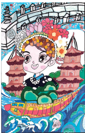
《泉州绮梦·海韵逐风》

作品以头戴簪花的蟳埔女、高耸的东西塔及栩栩如生的闽南古厝为创作元素,彰显着泉州的地域特色。构图巧妙,色彩鲜明,以儿童的第一视角,用童趣的笔触描绘一幅充满魅力的海丝泉州城。画面中海浪寓意着泉州的海洋文化,鲤鱼自由游动,以蟳埔女作为画面切入点,东西双塔的高耸则象征着泉州的崛起与繁荣,希望通过这幅画,能够激发更多人对海丝泉州的兴趣,探索这座城市的内涵与魅力。