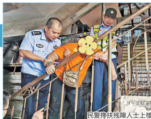
民警搀扶残障人士上楼

母子俩居住在三楼,需每天爬楼梯上下楼。平日儿子多在热心朋友帮助下下楼外出,但最近都只能由母亲来照顾,加上近期儿子不慎再次受