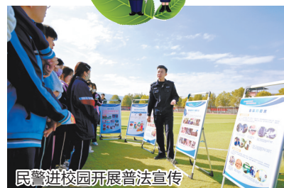
民警进校园开展普法宣传