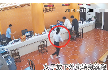
女子放下外卖转身就跑

卖追了出去,一边跑一边喊:“您的心意我们领了,但是东西不能收,这是我们的职责所在。”