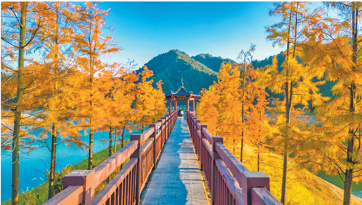
水杉树在冬日暖阳的照射下,呈现出金黄和鲜红的色彩,极具观赏性。