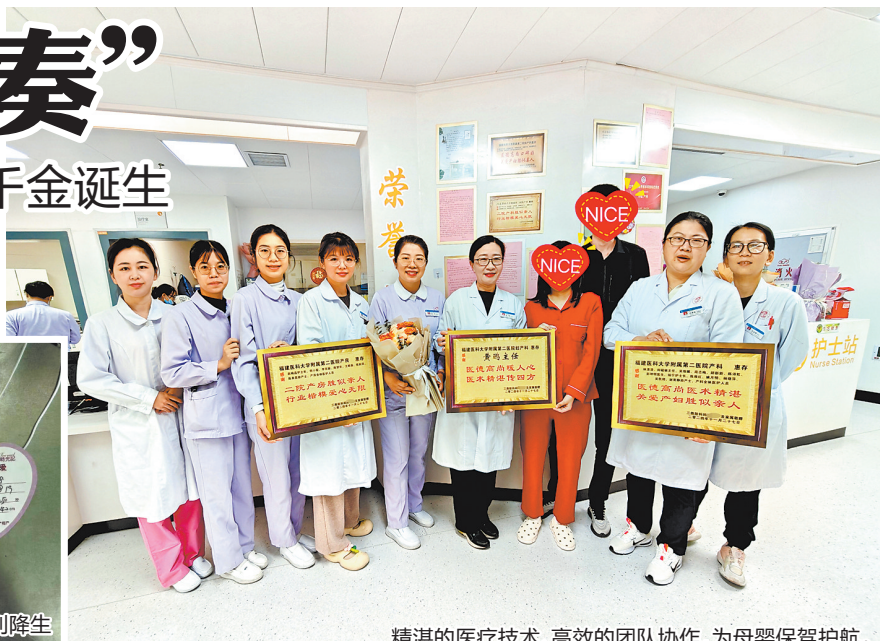
精湛的医疗技术、高效的团队协作,为母婴保驾护航。