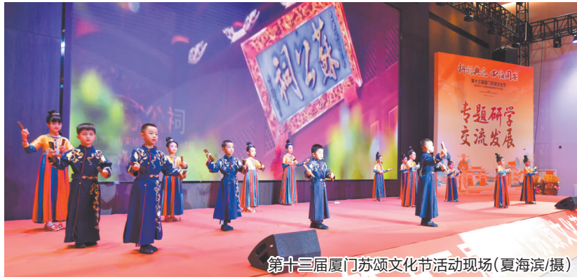
第十三届厦门苏颂文化节活动现场

本报讯(融媒体记者康云 通讯员余雪燕)科创赋能,向“新”发“力”,苏颂文化“活起来”!12月10日上午,第十三届厦门苏颂文化节暨新质生产力赋能高质量发展学术交流会在厦门同安举行。本届厦门苏颂文化节的主题是“科创典范四海同安”,来自世界各地的苏氏宗亲、海峡两岸的专家学者等齐聚一堂,共襄盛举。