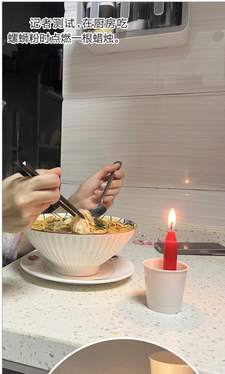
记者测试,在厨房吃螺蛳粉时点燃一根蜡烛。

记者获悉,近期在杭州萧山区、厦门海沧区等地发生了市民为去味点蜡烛,结果不慎导致起火的案例,当地消防部门发布提醒,不建议用点蜡烛的方式除味。想要去除室内异味,可打开窗户让空气流通或使用空气净化器。