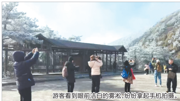
游客看到眼前洁白的雾凇,纷纷拿起手机拍摄。