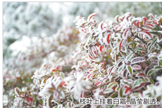
枝叶上挂着白霜,晶莹剔透。