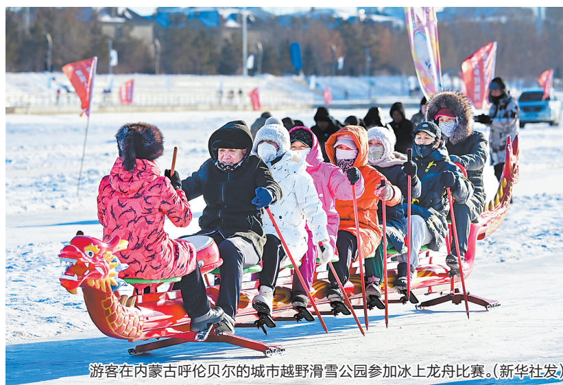
游客在内蒙古呼伦贝尔的城市越野滑雪公园参加冰上龙舟比赛。