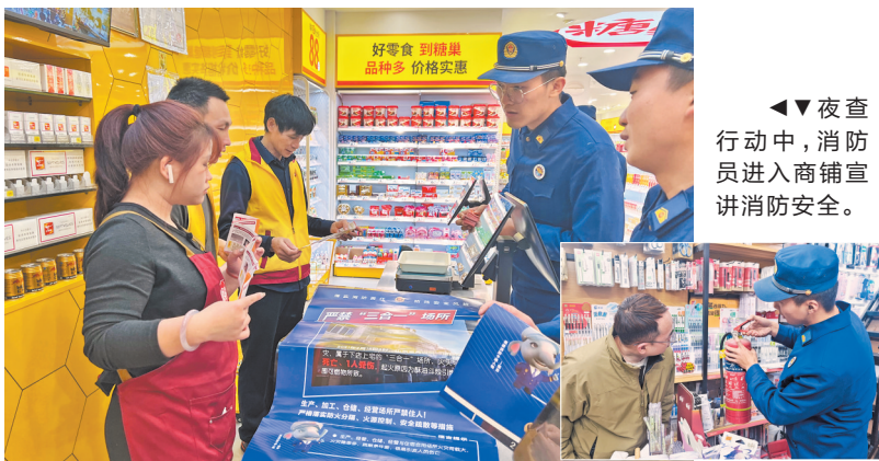
夜查行动中,消防员进入商铺宣讲消防安全。

本报讯(融媒体记者傅恒 通讯员许振塔 文/图)进入冬季以来,居民用火用电用气量增大,火灾安全隐患升高。12月24日起,泉州消防部门联合住建、公安等部门集中开展夜查统一行动。