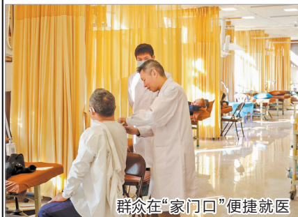
群众在“家门口”便捷就医

近年来,丰泽区高度重视卫生健康事业发展,加快补齐医疗卫生短板,实施总投资6.51亿元的公共卫生服务能力提升工程包。除城东街道社区卫生服务中心过渡业务用房建成投用外,其他卫生重点项目也正紧锣密鼓推进中。其中,北峰街道社区卫生服务中心翻建项目完成初验,东海街道社区卫生服务中心主体封顶,正在进行室内外装修和设备安装。同时,丰泽先后启动华大街道社区卫生服务中心及养老院、妇幼保健院二期、东海街道社区卫生服务中心二期等一批医疗卫生项目,持续推动医疗卫生服务基础设施建设提档升级。