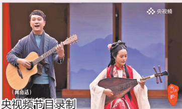
参加央视、央视频道录制

近段时间,“李春波在泉州用闽南语唱《小芳》”登上微博同城热搜榜第一,成为热点话题。而这也让改编歌曲《小芳》的泉州本土乐队南音新势力更多地走进大众的视野。这是一支致力于用好听的音乐唤起人们对南音、闽南语的记忆,进而推进闽南文化传承的乐队。乐队的乐手都是土生土长的泉州人,他们的原创歌曲《刺桐》《泉州的生活》《月娘月光光》等巧妙地将南音融入民谣、雷鬼、流行等各种类型的音乐中,并且在保留琵琶、洞箫等南音传统乐器的基础上,加入吉他、鼓、贝斯等现代电音乐器,既保持了南音的韵味,又增添了闽南语歌曲的丰富性和层次感,受到许多年轻人的关注。