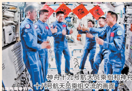
神舟十九号航天员乘组和神舟十八号航天员乘组交流的画面