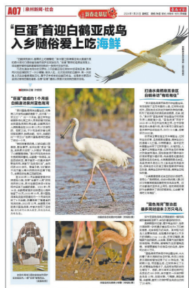
2024年1月26日 《东南早报》报道版面