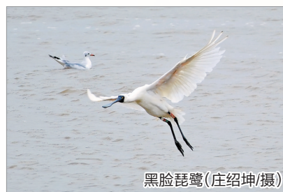
黑脸琵鹭