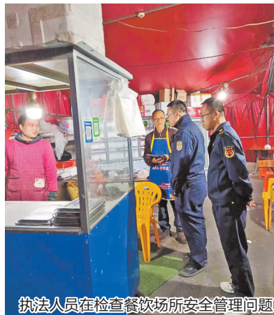
执法人员在检查餐饮场所安全管理问题

在餐饮油烟治理方面,执法人员深入辖区各餐饮场所,仔细检查油烟净化设备的安装、使用及维护情况。对部分未正常使用或清洗不及时商户,立即发放整改通知,要求限期整改,并杜绝“装而不用、用而不洗”现象出现,切实从源头减少油烟污染。在燃气安全整治方面,执法人员紧盯重要场所和人群聚集区域,开展全方位的燃气安全检查,督促餐饮场所做好燃气安全管理工作。