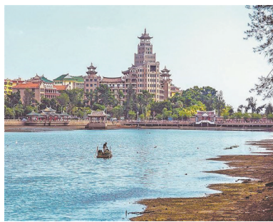
嘉庚教育遗产有望在未来申报世界文化遗产

厦门市文旅局相关负责人介绍,近年来,厦门市精心保护修缮,提升改善文物保护状况;举办陈列展览,弘扬嘉庚精神;提升文物级别,申报和公布一批能列入各级文物保护单位的嘉庚教育遗产;不断加大保护力度,为嘉庚教育遗产的成功入围奠定了基础。(海晨 厦日)