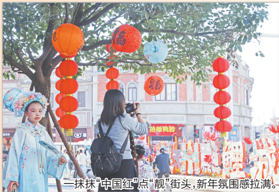
一抹抹“中国红”点“靓”街头,新年氛围感拉满。