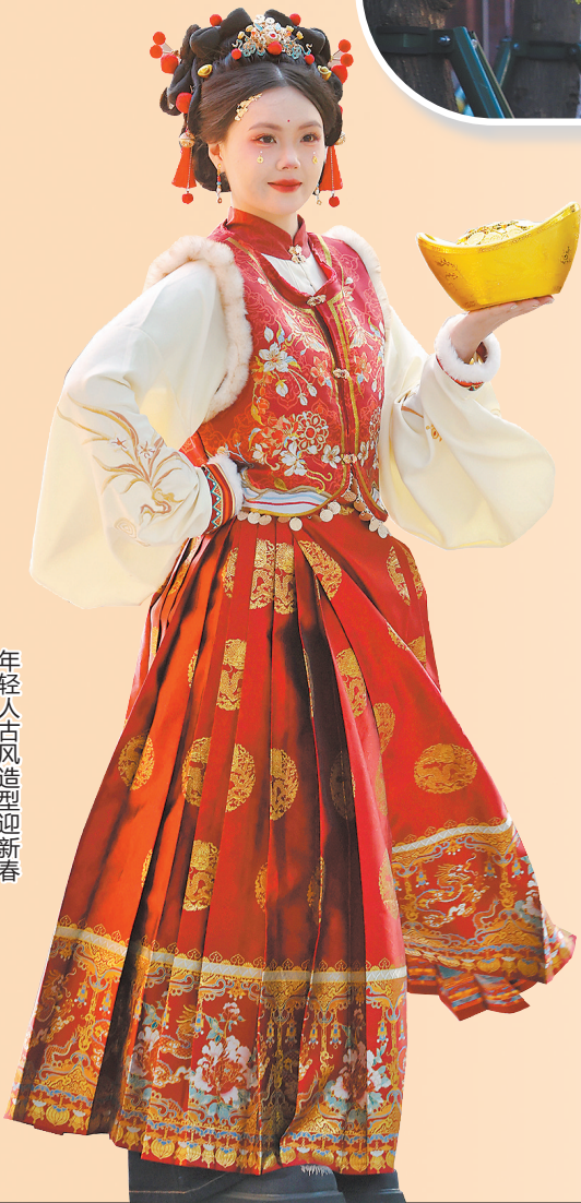
年轻人古风造型迎新春