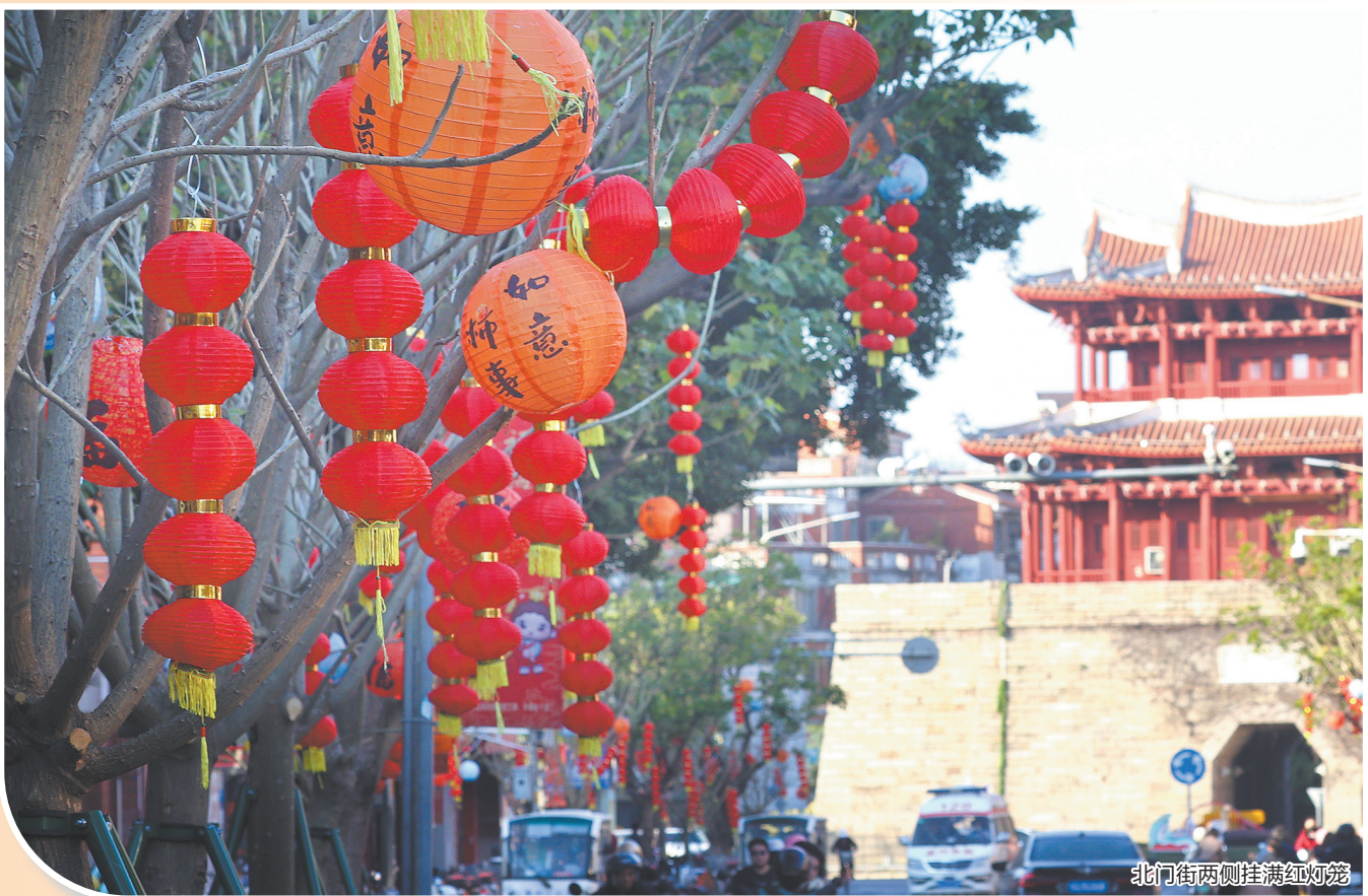
北门街两侧挂满红灯笼

据悉,春节氛围营造项目还在陆续展开,春节期间将为市民和游客带来更加美好的体验。