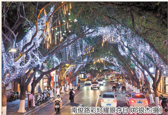
南俊路彩灯耀眼夺目