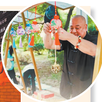
▲游客可沉浸式感受古人焚香、制香囊等习俗。