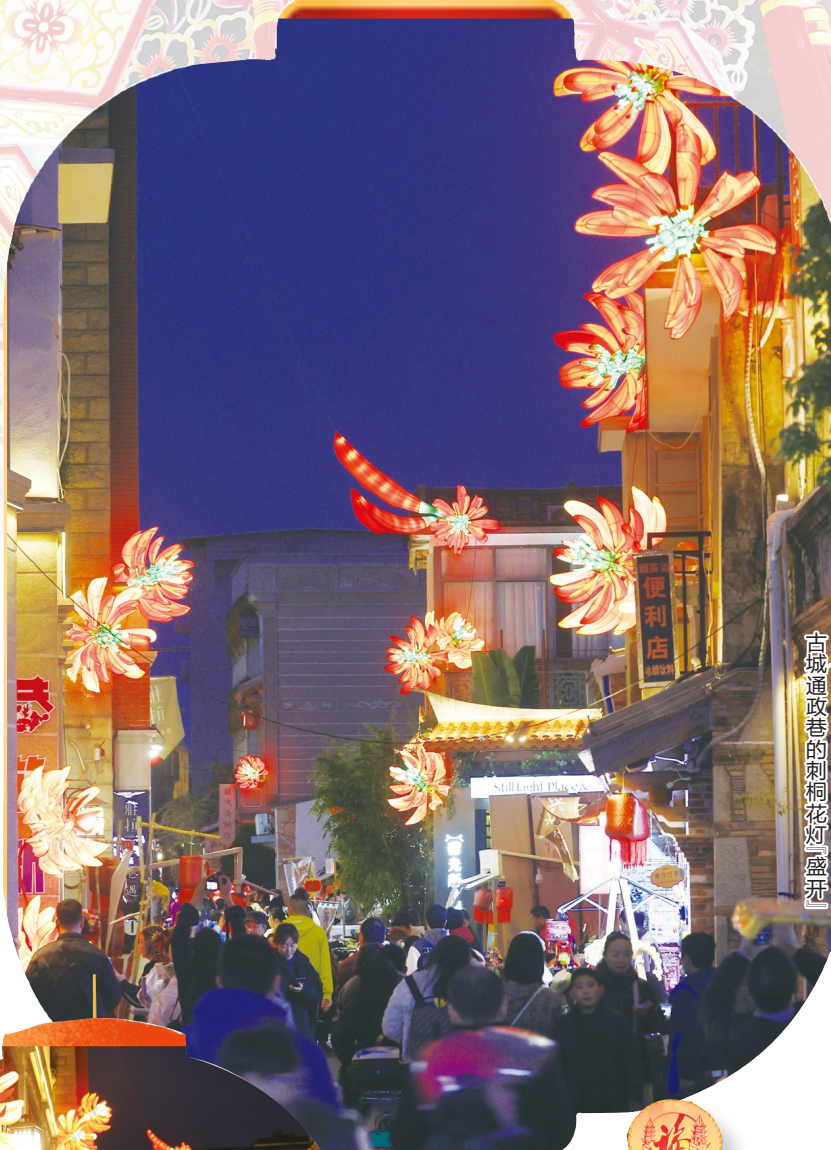
古城通政巷的刺桐花灯「盛开」

流光溢彩的泉州花灯让古城的夜景展现出别样的风姿和独特的魅力，也赢得无数市民游客点赞。