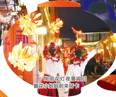
绚丽花灯夜景吸引簪花小姐姐前来打卡