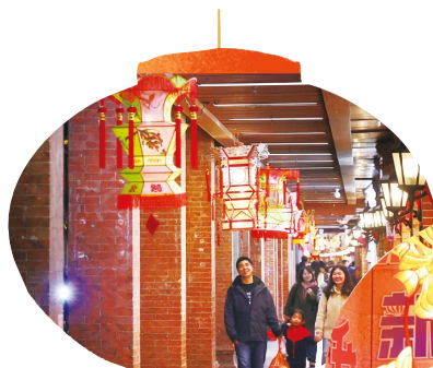
中山路骑楼下的花灯已经亮起