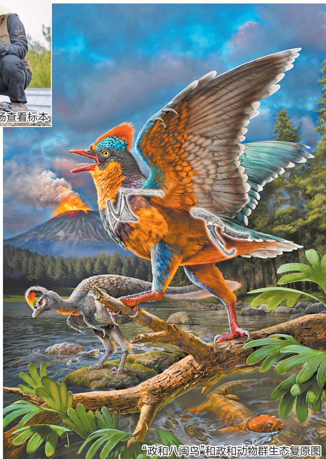
“政和八闽鸟”和政和动物群生态复原图

相关成果2月13日发表于国际学术期刊《自然》。英国爱丁堡大学古生物学家斯蒂芬·布鲁萨特在配发观点文章中评价:“政和八闽鸟是里程碑式的发现,是自19世纪60年代初始祖鸟化石发现以来,最重要的鸟类化石。”