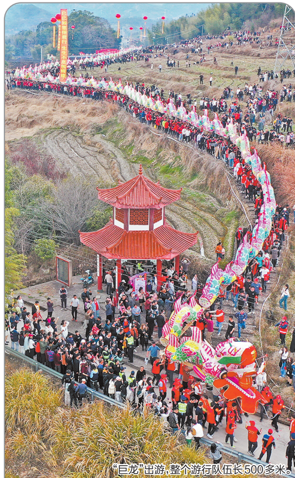
“巨龙”出游,整个游行队伍长500多米。