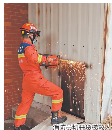
消防员切开货梯救人

根据现场情况,一名救援人员利用无齿锯将货梯背面铁皮切开一个较大缺口,然后另一人从缺口钻入货梯底部,配合在外部的救援人员将被困人员从切口抬出。随后,受困人员被移交由120送往医院进一步救治。