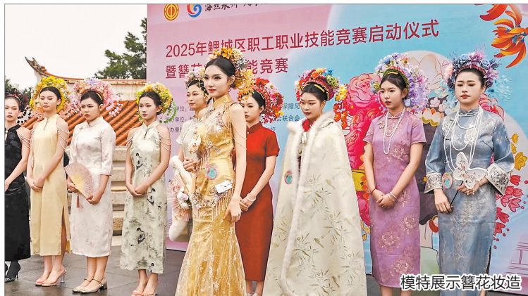
模特展示簪花妆造

本报讯(融媒体记者张素萍 通讯员许培吟 文/图)近日,“簪春·传韵”鲤城区簪花妆造技能竞赛在西街举行,33名选手同台比拼、各展所长,由此正式拉开了2025年鲤城区职工职业技能竞赛的序幕。