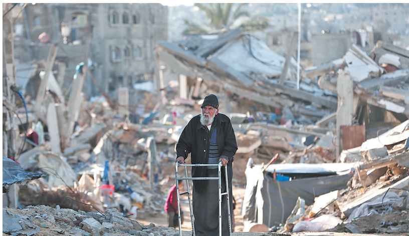
3月22日,一名从加沙地带北部拜特拉希耶撤离的巴勒斯坦老人经过加沙城。

综合半岛电视台、美联社报道,以军22日空袭黎巴嫩多地,造成至少7人死亡。这是以色列与黎真主党自2024年11月停火以来最激烈的交火,给停火协议的实施前景带来不确定性。