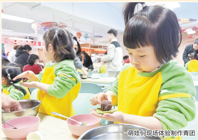
萌娃们现场体验制作青团

早报讯（融媒体记者傅蓉蓉 通讯员陈婕 陈惠婷 李鲁琳 文/图）近日，泉州幼师附属幼儿园开展清明食育主题活动，小班萌娃们通过揉、捏、塑、点四步技法，完成艾香扑鼻的传统时令美食，体验节气文化魅力。