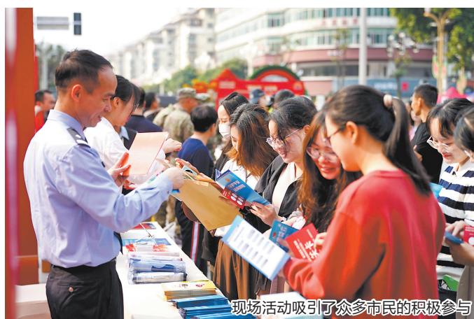
现场活动吸引了众多市民的积极参与

早报讯 (融媒体记者邱丰 通讯员杜冰莹 叶超 文/图)今年4月15日是第10个全民国家安全教育日。为切实增强全民国家安全和素养,筑牢国家安全人民防线,安溪县委国安办联合安溪县委宣传部、安溪县委政法委、安溪县人武部、安溪县红十字会等10多个部门,于4月11日在安溪县人民广场集中开展4·15全民国家安全教育日宣传活动。