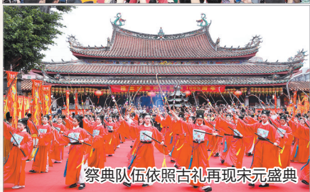
祭典队伍依照古礼再现宋元盛典

早报讯 (融媒体记者张素萍 王柏峰 通讯员吴秋瑜 文/图) 4月20日(农历三月廿三)是妈祖诞辰1065周年纪念日。当天,纪念妈祖诞辰1065周年活动在泉州天后宫举行。众多妈祖文化机构代表、妈祖敬仰者等齐聚天后宫,同谒妈祖,共襄盛会。