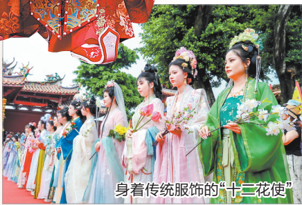
身着传统服饰的“十二花使”