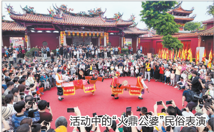
活动中的“火鼎公婆”民俗表演