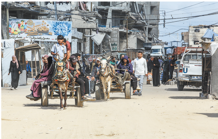
当地时间5月5日,加沙哈尼尤斯,因以色列攻击导致燃油短缺,巴勒斯坦人使用马和驴车进行交通运输,因边境口岸关闭及持续封锁,出租车大多无法提供服务,柴油和汽油在加沙地带无法供应。

据报道,扩大的军事行动计划将不会立刻执行,目前以色列仍将继续寻求与巴勒斯坦伊斯兰抵抗运动(哈马斯)达成停火换人协议。报道称,以色列安全内阁还批准恢复向加沙地带运送援助物资。根据新方案,援助将改由国际组织和私人安保承包商直接向加沙家庭发放食品。以军将不直接参与物资分发,而是负责为发放过程提供外围安全保障。(陈君清 王卓伦)