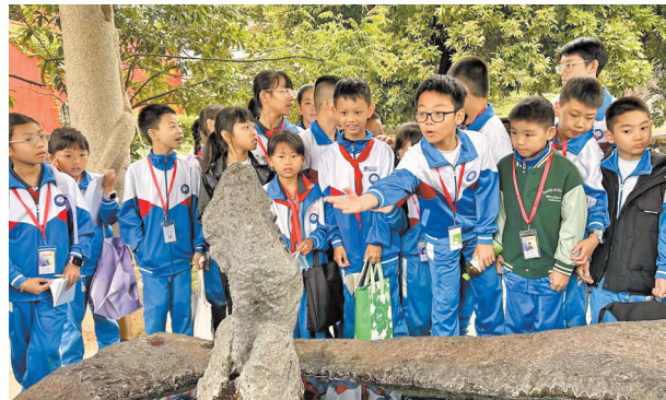
►小记者走进少林寺