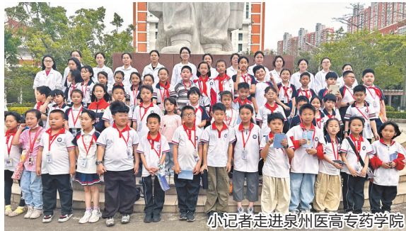
小记者走进泉州医高专药学院