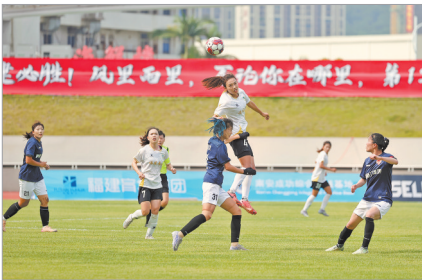
福建南安成功女足的姑娘们(白色上衣)在场上敢拼敢抢