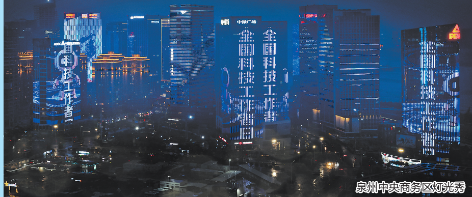
泉州中央商务区灯光秀

早报讯(融媒体记者张素萍 王柏峰 王耿华 文/图)今年5月30日是第九个“全国科技工作者日”。5月28日晚,在“全国科技工作者日”到来之际,泉州市科协推出以“矢志创新发展 建设科技强国”为主题的灯光秀,在泉州中央商务区、泰禾广场酷炫上演,向全市科技工作者致以崇高的敬意。