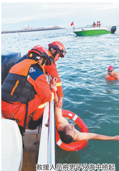
救援人员将男子从海中捞起

早报讯(融媒体记者林志安 通讯员刘超峰 文/图)6月1日傍晚,一男子在惠安县崇武镇西沙湾海边游泳时因腿脚抽筋溺水,所幸当地消防部门与海泳协会人员及时救援。