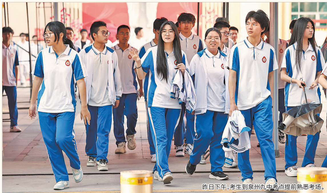
昨日下午,考生到泉州九中考点提前熟悉考场。