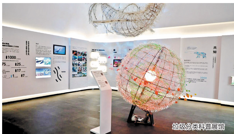
垃圾分类科普展馆

慈济大爱美好生活馆位于鲤城区金龙街道浮桥街405号,占地面积700余平方米,由慈济慈善事业基金会环保站升级改造而成,设有人文馆、地球馆、7R共行馆、大爱感恩科技馆、环保共创空间、垃圾分类实践区等主题空间。该馆免费向市民开放参观,通过展览、讲座、分类实践、手工制作等多种形式,普及生态环保