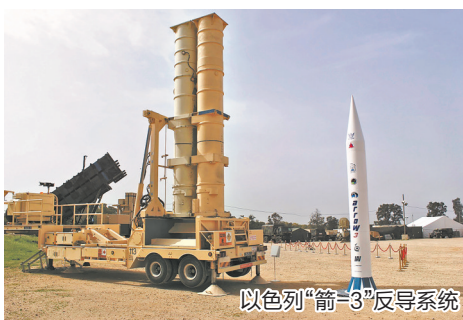
以色列“箭-3”反导系统