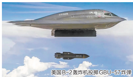
美国B-2轰炸机投掷GBU-57炸弹

在此轮以色列与伊朗的大规模冲突中,部分先进装备的名称不断在媒体上出现,成为“明星武器”。