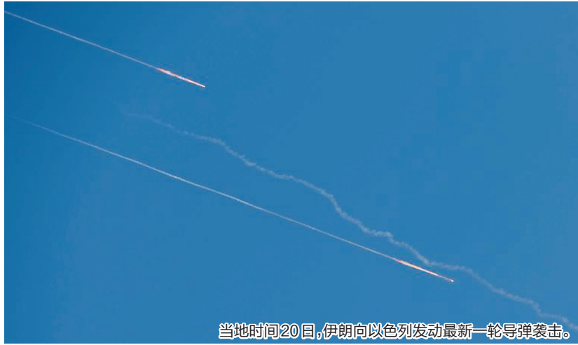
当地时间20日,伊朗向以色列发动新一轮导弹袭击。

当地时间20日上午,以色列国防部部长卡茨与以色列国防军总参谋长扎米尔及其他高级军官举行了军事评估会议。