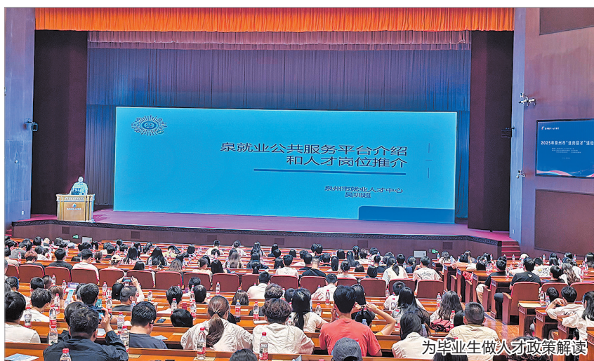
为毕业生做人才政策解读