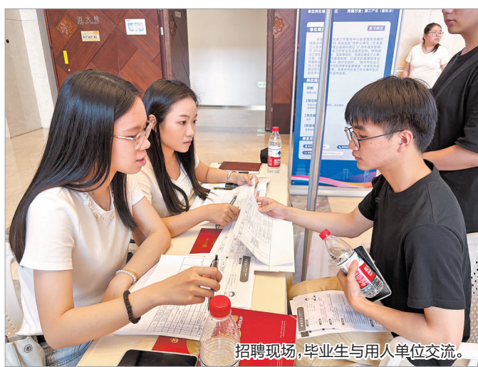
招聘现场,毕业生与用人单位交流。