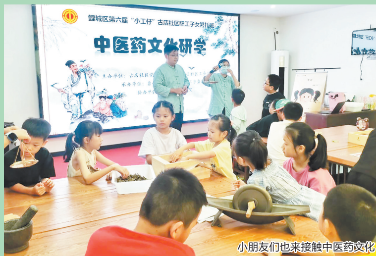
小朋友们也来接触中医药文化

早报讯 (融媒体记者张素萍 通讯员刘薇 陈丹萍 文/图)6月25日,由泉州市卫健委主办,鲤城区卫健局、海滨街道、区招商办承办的泉州市“中医药+文旅”融合暨中山南路中医药文化街区推介会举行,泉州中山南路作为古城现存唯一成片保留的骑楼商业区,即将迎来华丽蜕变。