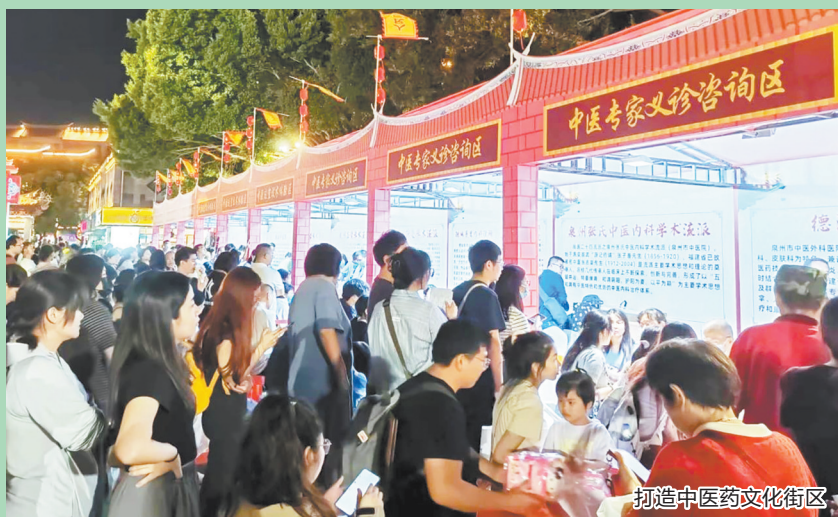
打造中医药文化街区