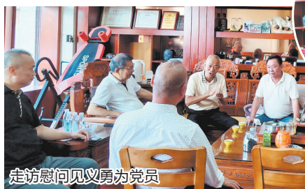
走访慰问见义勇为党员