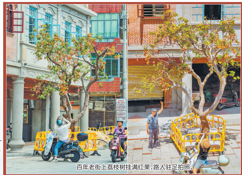
百年老街上荔枝树挂满红果,路人驻足拍照。