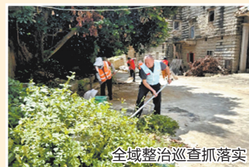
全域整治巡查抓落实