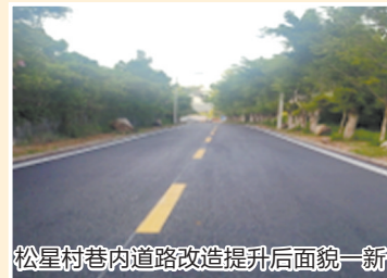
松星村巷内道路改造提升后面貌一新