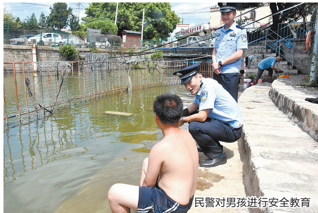
民警对男孩进行安全教育

本报讯(融媒体记者许奕梅 通讯员曾锋榕 文/图)暑假来临,正是戏水消暑好时节,但安全意识不可松懈。7月3日上午,泉州市公安局常泰派出所组织民警深入辖区涉险公共区域开展日常巡查时,及时劝阻一名在水闸内涉水孩童,织密暑期防溺水“安全网”。