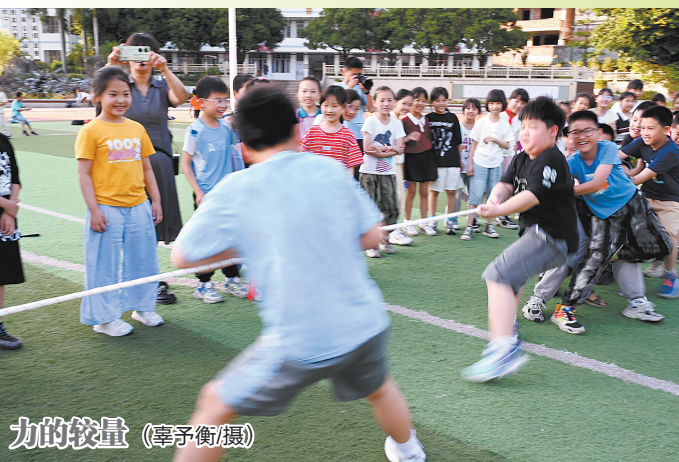
力的较量