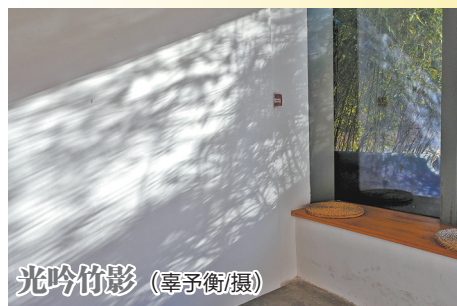
光吟竹影