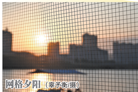
网格夕阳

本期《泉摄汇》特别呈现,带您一同领略两位小摄影家捕捉的精彩瞬间,感受他们用镜头讲述的成长故事。