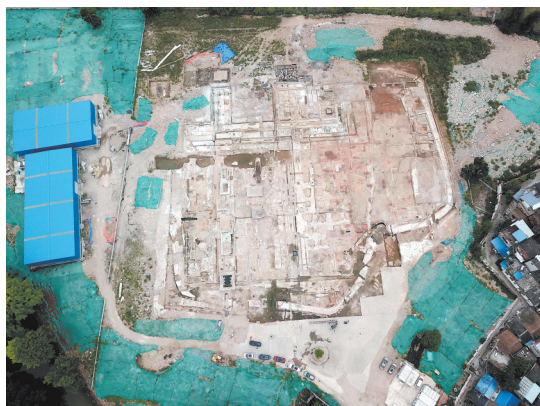
2022年3月22日拍摄的位于广州市海珠区的南石头监狱遗址与海港检疫所旧址(无人机照片)