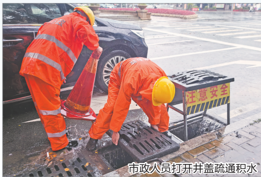
市政人员打开井盖疏通积水