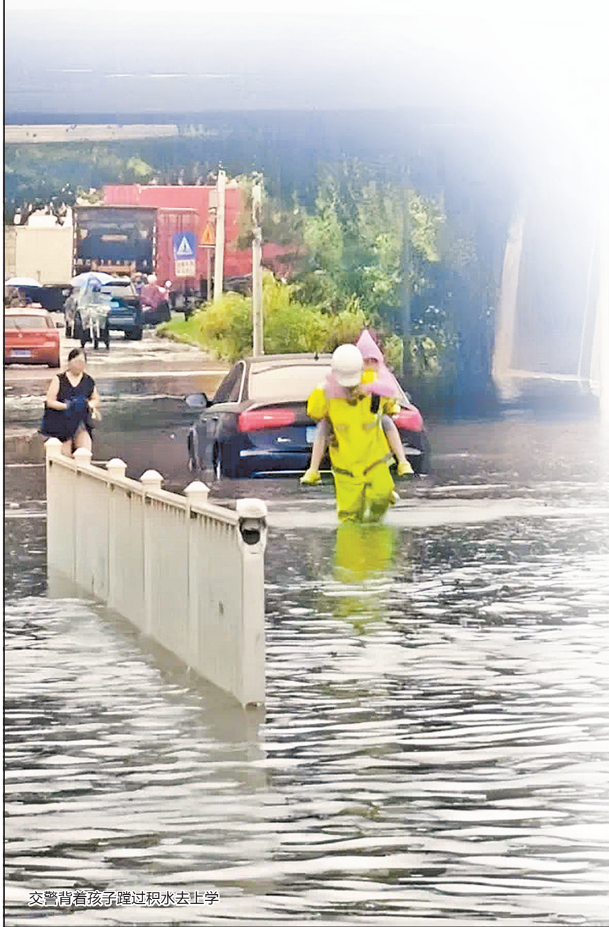
交警背着孩子蹚过积水去上学