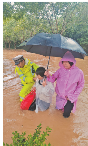
路面积水严重,交警护送群众通过。

10日上午,受强降雨影响,晋江市大深线浔兴路段存在积水严重影响通行,晋江交警深沪中队民警徒手清理被堵塞的下水管道。无独有偶,当日上午暴雨过后,南安石井埭头村路段积水难消,南安交警大队民警冒雨涉水徒手清理下水道的杂物,使积水排出,确保道路安全。