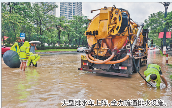
大型排水车上阵,全力疏通排水设施。