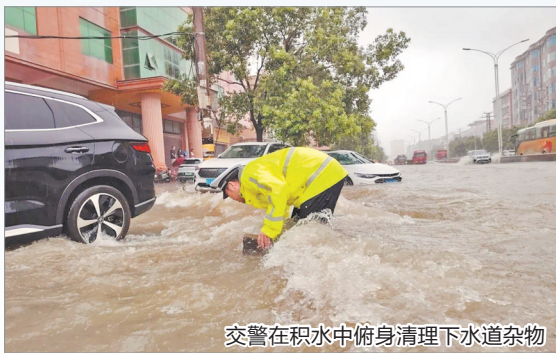
交警在积水中俯身清理下水道杂物