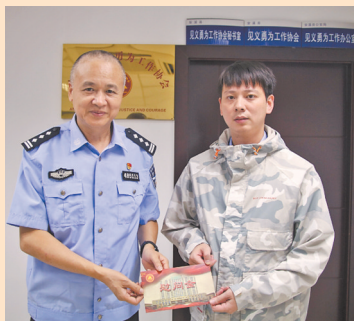
为见义勇为积极分子送上慰问金