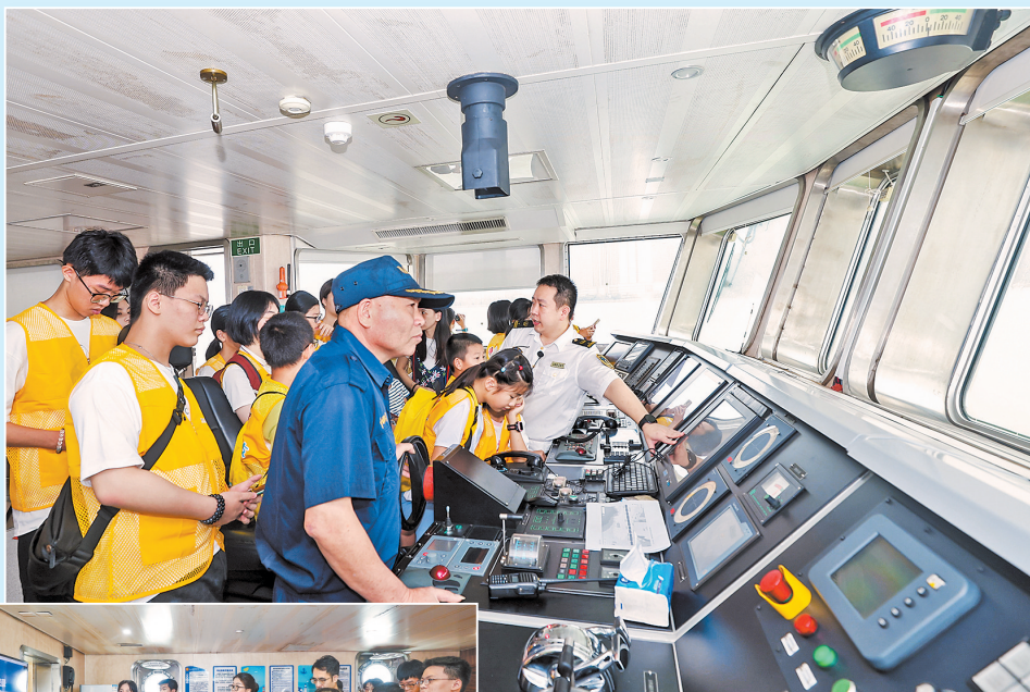
▲参观船舶的驾驶室