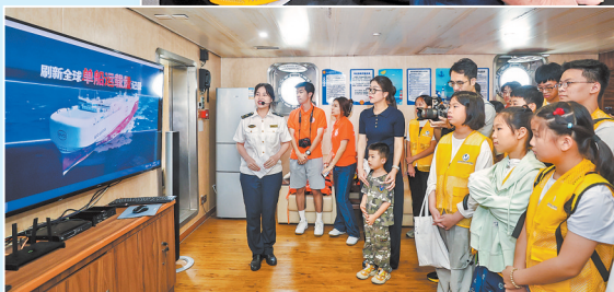
◀了解我国船舶在绿色智能发展道路上取得的成果

早报讯 （通讯员张萍茹 罗艳涓 融媒体记者许钺钺 文/图）7月11日，恰逢中国航海日设立20周年、郑和下西洋620周年。今年的航海日以“绿色航海，向新图强”为主题。当天，泉州海事局联合泉州海外交通史博物馆、东海航海保障中心厦门航标处开展“探秘绿色航海 传承丝路精神”——2025年中国航海日“福见海事”体验营活动。50名青少年学员共同乘坐海巡“0806”艇，从后渚码头航行至泉州湾跨海大桥，开启沉浸式航海体验。