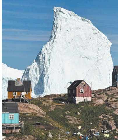
巨大的冰山与山坡上的房屋形成鲜明的对比

日本西南部鹿儿岛县吐噶喇列岛14日继续发生地震。自6月21日以来,吐噶喇列岛的有感地震已经超过2000次。