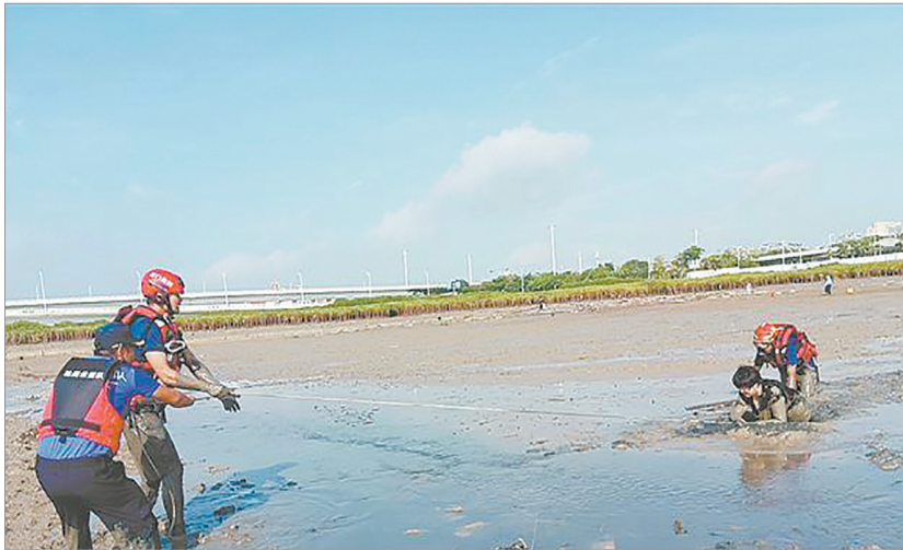
救援队员用救生圈施救