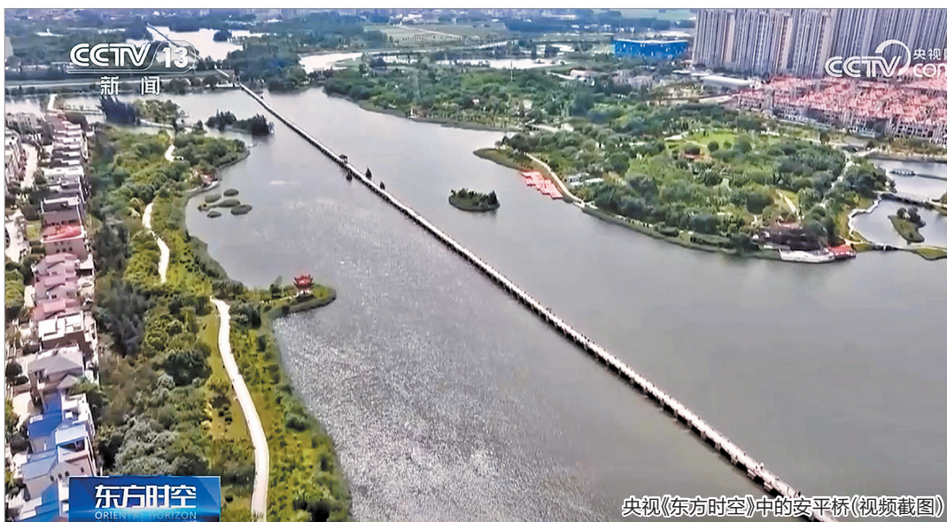
央视《东方时空》中的安平桥(视频截图)