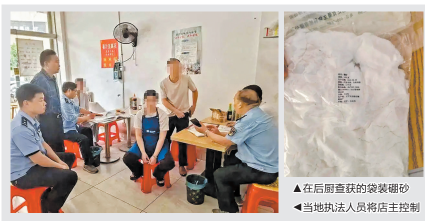
▲在后厨查获的袋装硼砂 ▲当地执法人员将店主控制